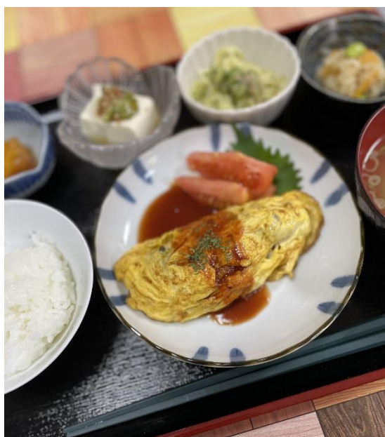
カボチャとひき肉のオムレツ