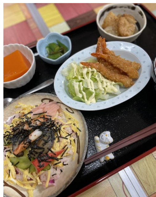
ちらし寿し えびフライ