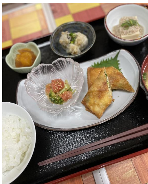
エビと三ツ葉の春巻き